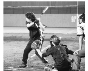
大盛り上がりの地域子育て支援課チーム↑