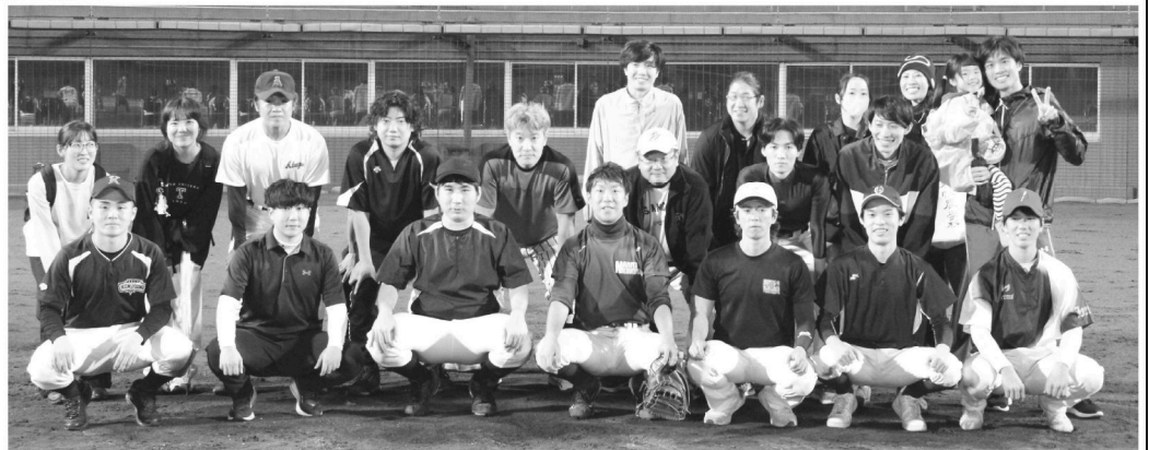
医療センターチーム& 応援団⇒